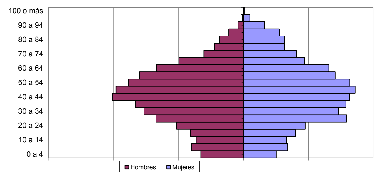
GRÁFICO 2: PIRÁMIDE POBLACIONAL CASCO VIEJO/ALDE ZAHARRA

Fuente: Elaboración propia. Datos Padrón Pamplona-Iruña. Febrero 2020.