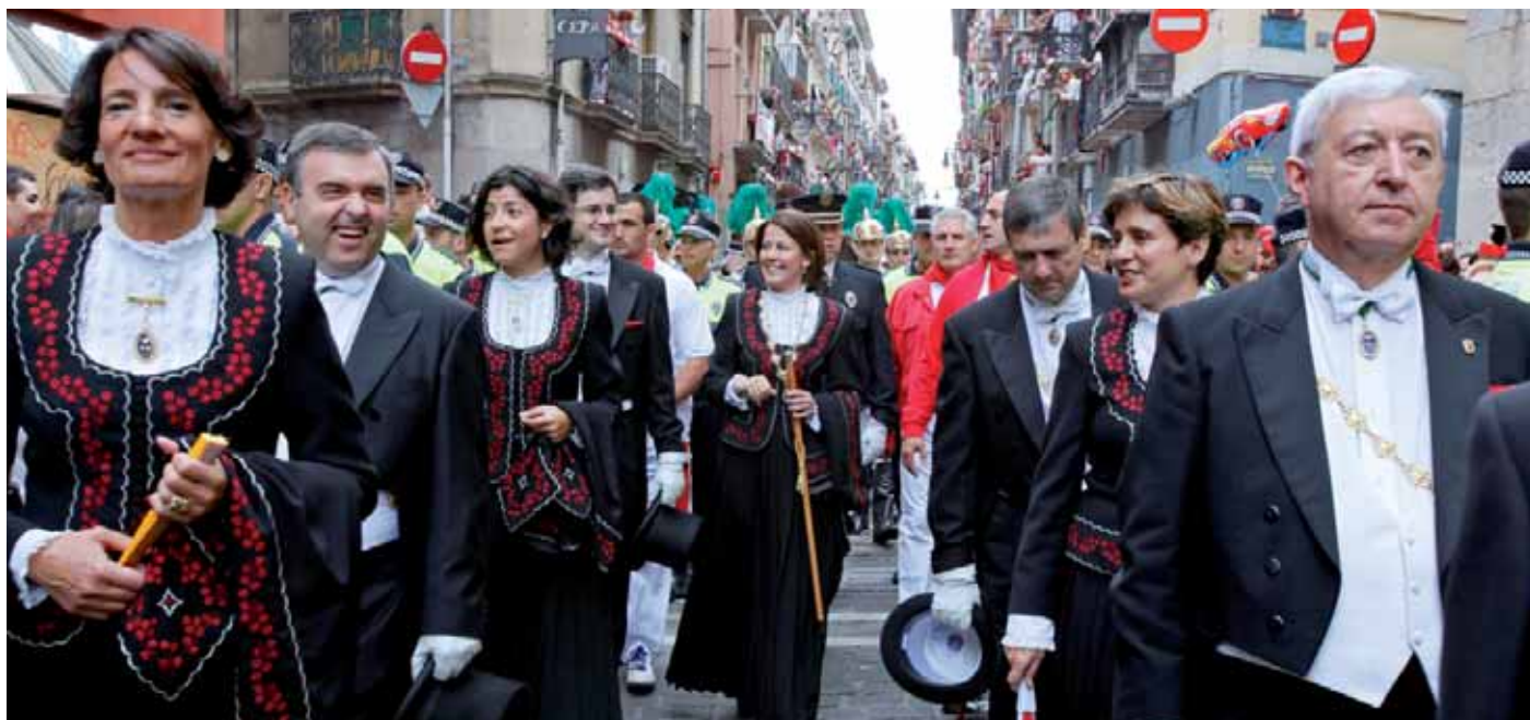
> Uztailaren 7ko prozesioa